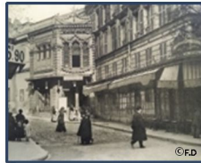
Le Théâtre Moncey Rue Pierre Ginier

Les alentours de la place de Clichy offraient de nombreux plaisirs. Ouvriers et notables, artistes, malfrats, tous se pressaient aux entrées des salles de spectacle tel le mythique hippodrome, « l'Hippo-Palace » ensuite transformé en cinéma, « le Gaumont- Palace ». Les cabarets, les théâtres, les cirques ne désemplissaient pas. Le samedi soir, les bals musette faisaient salle pleine. Ecrivains, peintres, sculpteurs et journalistes tenaient salon dans les restaurants.