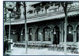
La brasserie Wépler en 1900 Place de Clichy