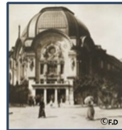
L'Hippo-Palace Place de Clichy