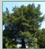
If classé "remarquable": circonférence de 2,9m. et hauteur de 11 m. (div. 14)

En revenant vers la div. 28, avenue de la Croix, il ne faut pas manquer la chapelle Fournier. Inscrite au titre des Monuments historiques en 2013, elle est édifée en pierre calcaire; son corps principal est une élévation très sobre de style antiquesant ; le corps arrière, en contrebas, contient des enfus (niches funéraires). Cette chapelle est l'œuvre de l'architecte Laurecisque qui